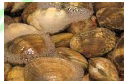
صدف ۲ کفه ای